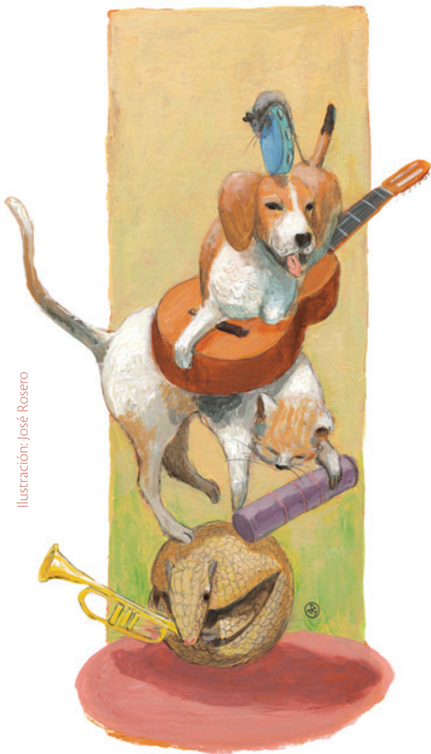
Ilustración: José Rosero

Letra y música / Lyrics and music: Jorge Velosa Ruiz