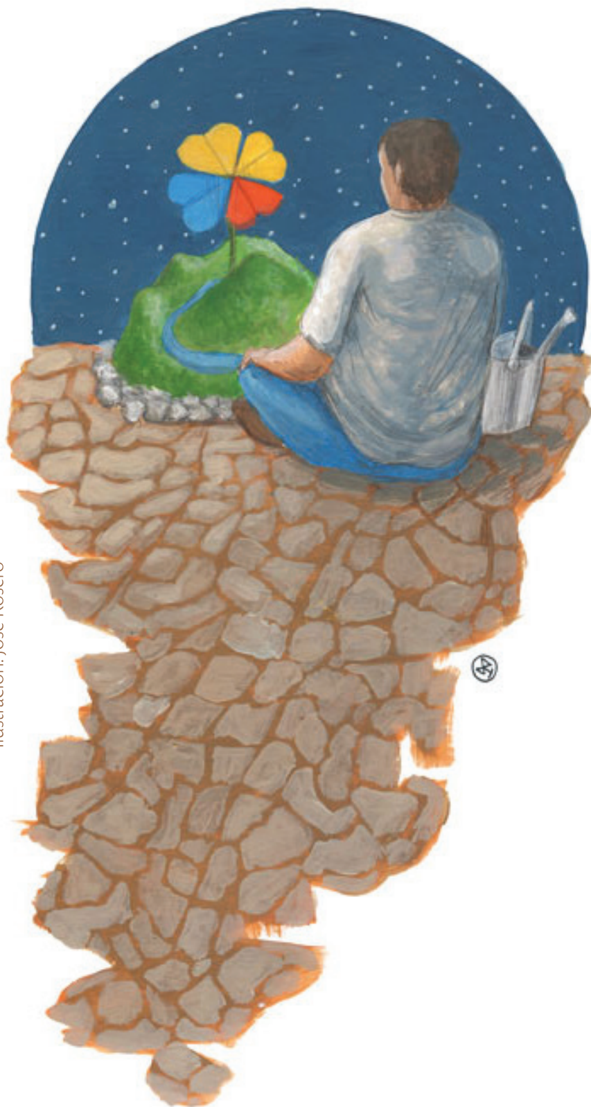
Ilustración: José Rosero

Letra y música / Lyrics and music: José Ricardo Bautista Pamplona