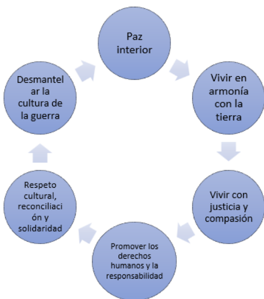
Seis pétalos de la educación para la paz” Swee-Hin Toh

Es en ese escenario, en donde este modelo de educación para la paz que se originó en Filipinas y que ha sido adaptado a otras regiones del mundo, se desarrolla alrededor de la metáfora de la flor compuesta por seis pétalos temáticos interrelacionados entre sí. Los “Seis pétalos de la educación para la paz” permite comprender la interconexión y el enfoque holístico de la educación para la paz en el abordaje con NNAJ y comunidades: